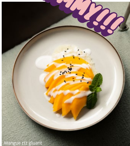
Mangue riz gluant