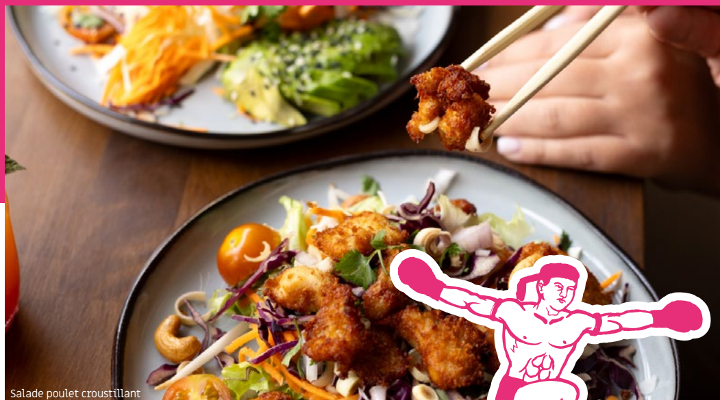
Salade poulet croustillant