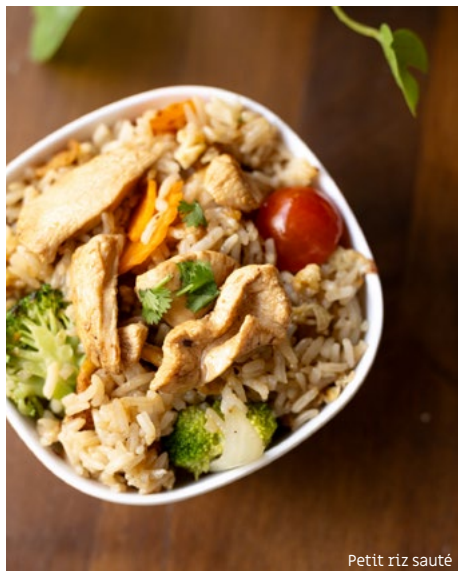
Petit riz sauté