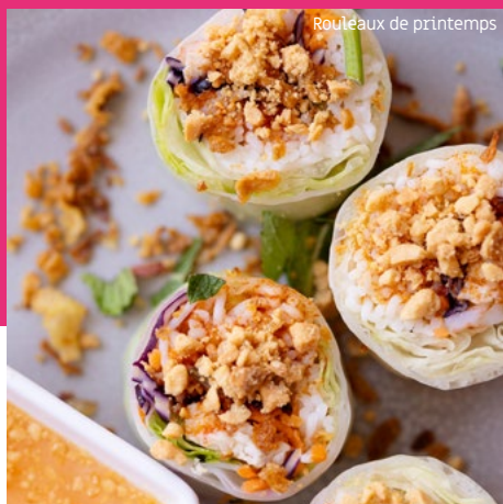
Rouleaux de printemps