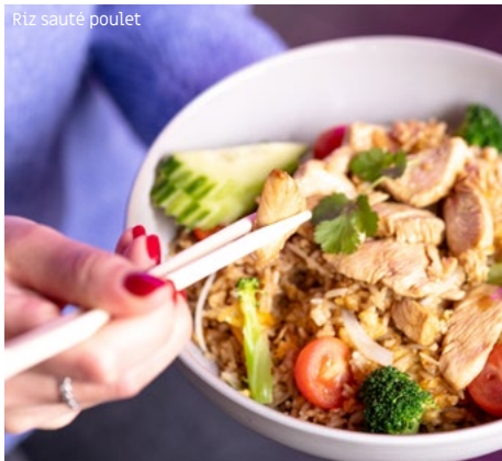
Riz sauté poulet