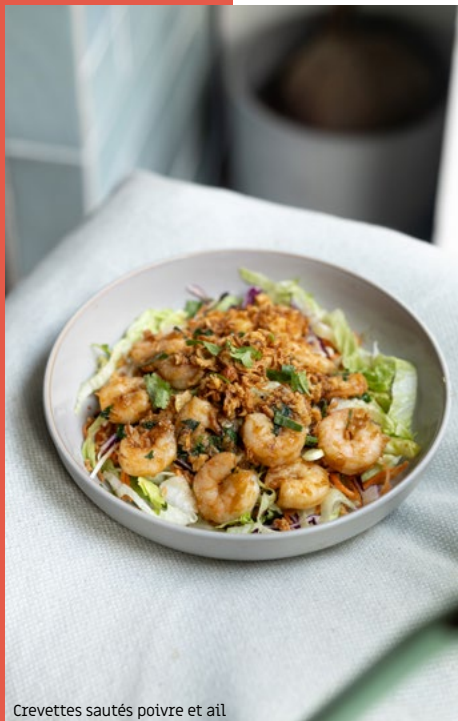
Crevettes sautées poivre et ail