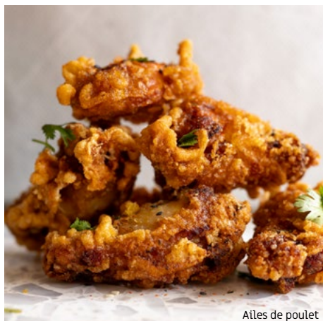
Ailes de poulet